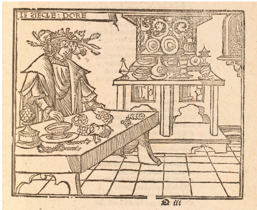
GUILLAUME MICHEL, Le siecle doré, contenant le temps de paix, amour, et concorde , Paris, Hemon le Fevre, 1521, fol. 91r.

Pour être domination, le pouvoir doit faire la preuve de sa légitimité. Or la meilleure légitimation est de signifier à tous son évidence. Les différents travaux relatifs aux mécanismes du pouvoir montrent tous, à des degrés plus ou moins divers, la nécessaire participation des dominés. Ils acceptent, jusqu'à un certain point, la domination, voire concourent à la conservation/reproduction de cette dernière.